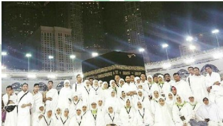
Dokumentasi jamaah di tanah suci