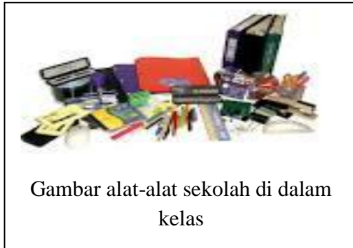
Gambar alat-alat sekolah di dalam kelas