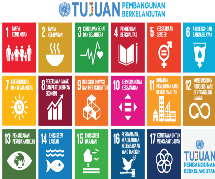
Gambar 2.1 Tujuan Pembangunan Berkelanjutan