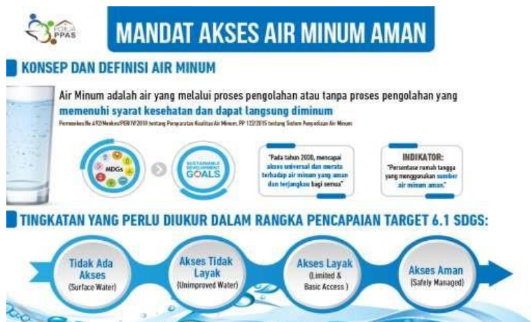
Gambar 2.2 Akses Air Minum Aman

terpencil atau miskin, memiliki akses fisik yang mudah dan terjangkau terhadap sumber air minum yang aman. Hal ini dapat melibatkan pembangunan infrastruktur seperti sumur, pipa distribusi air, atau penyediaan jaringan pipa di perkotaan. Dan pendidikan tinggi merupakan kekuatan pendorong perubahan. 42