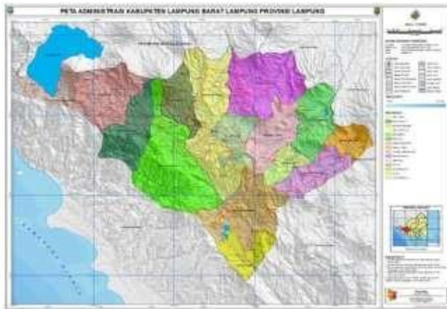
Gambar 2.3 Peta wilayah Kabupaten Lampung Barat

Kabupaten Lampung Barat memiliki luas wilayah 2.116,01 km 2 dan terdiri dari 15 kecamatan yaitu sebagai berikut: