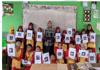
kegiatan setelah penerapan quizzz