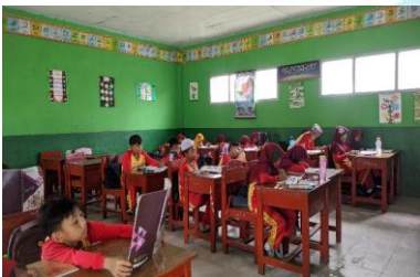
Kegiatan menjelaskan materi