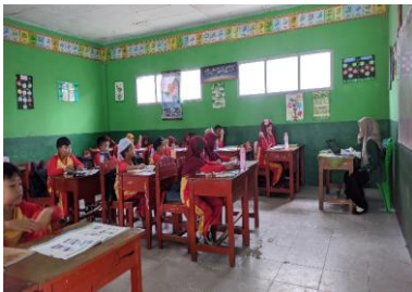
Kegiatan membaca bersama