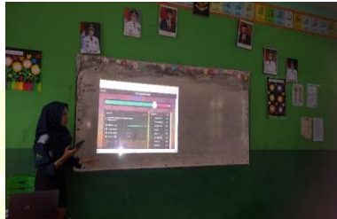
Kegiatan penerapan media quizizz