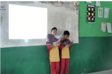
Kegiatan membaca di depan kelas