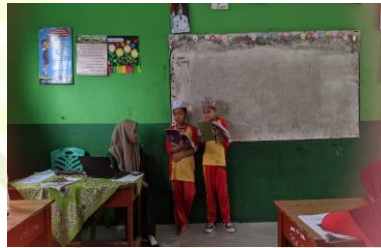
kegiatan membaca di depan kelas