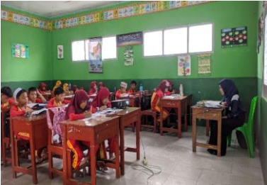
Kegiatan membaca bersama sama