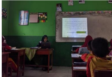
Kegiatan menjelaskan/menerjemahkan materi