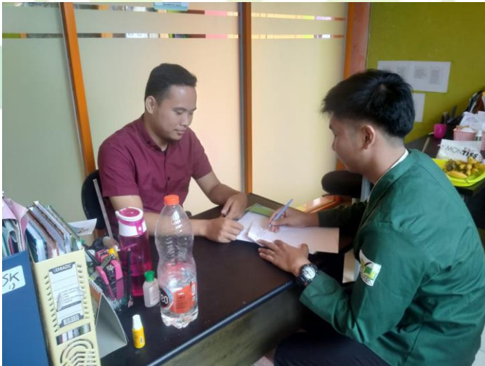
Gambar 2 : Wawancara dengan Operator Sekolah