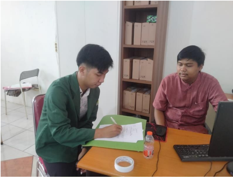
Gambar 3: Wawancara dengan Waka Kesiswaan