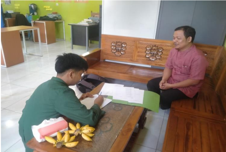
Gambar 1 : Wawancara dengan Kepala Sekolah