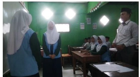
Praktik Berperan Sesuai Yang Di Perankan