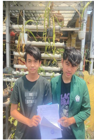
Gambar 12 (Wawancara dengan Kakak Nando)