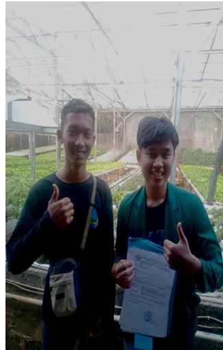
Gambar 14 (Wawancara dengan Kakak Andre)