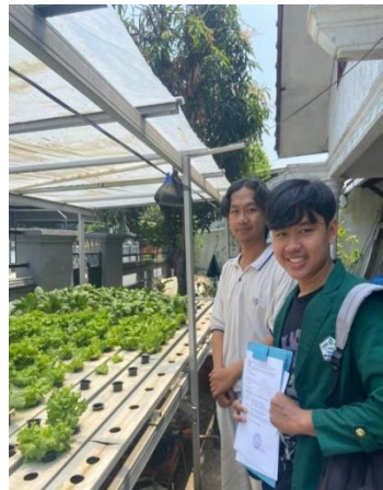
Gambar 8 (Wawancara dengan Kakak Edo)