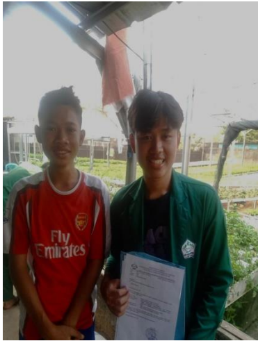
Gambar 21 (Wawancara dengan Kakak Wahyu)