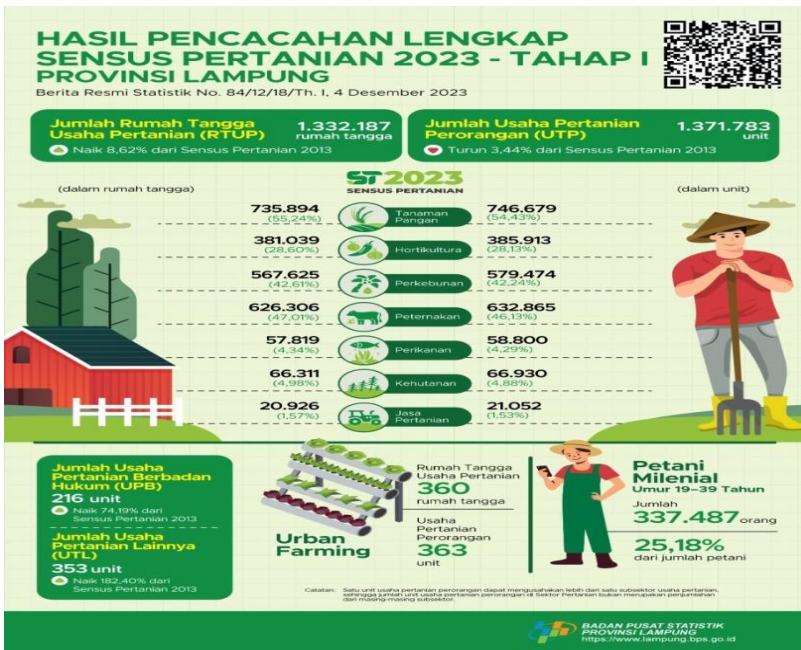
Gambar 1.1 Data Sensus Pertanian Lampung 2023

Dilihat dari tabel 1.1 diatas menunjukkan bahwa Jumlah