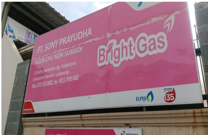
Gambar 4 : PT. Sony Prayudha Sukarame