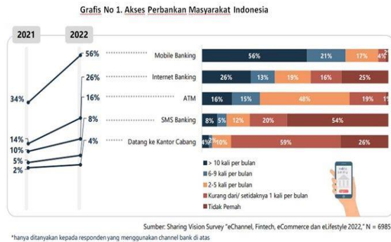
Gambar 1.2 Akses Pengguna Mobile Banking