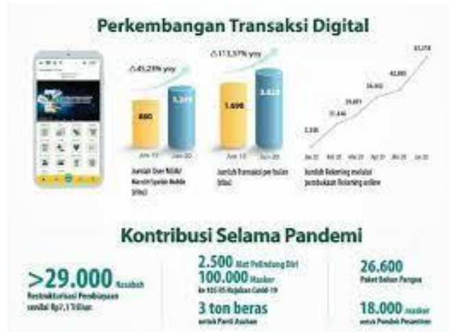
Gambar 1.1 Perkembangan Transaksi Digital

banking dalam mempermudah transaksi, terutama mobile banking syari'ah . 11