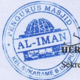
HERY GUSTOMI, SH