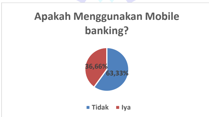
Gambar 1.3 Data Studi pendahulua

Penulis melakukan studi pendahuluan dengan bertujuan untuk mengamati minat masyarakat hulu sungkai dalam menggunakan mobile banking , melalui wawancara dengan pertanyaan“ Apakah menggunakan Mobile banking ? kepada 30 responden.