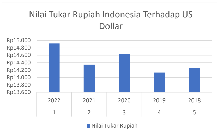
Gambar 1.2 Nilai Tukar Rupiah Terhadap Dollar Amerika Serikat Tahun 2018 – 2022