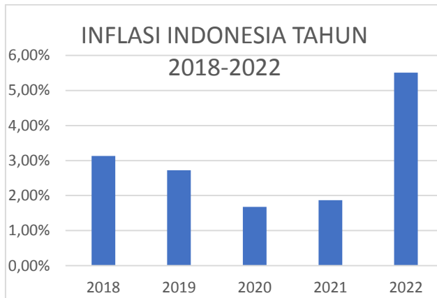
Gambar 1.1 Inflasi di Indonesia Tahun 2018-2022