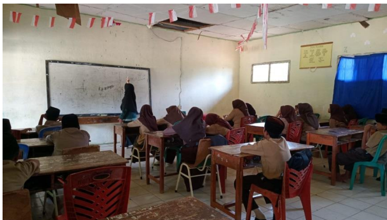
Gambar 1.7 Kegiatan Belajar Mengajar