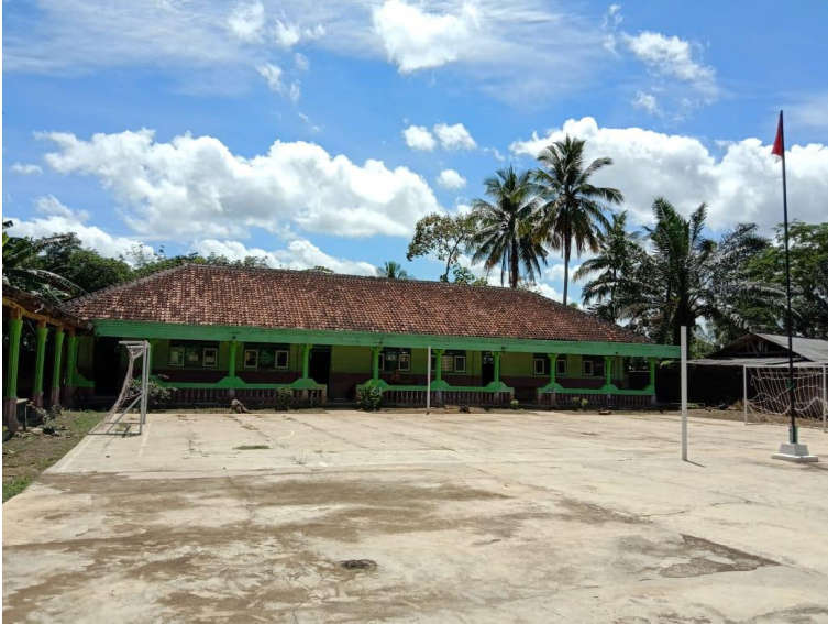
Gambar 1.3 Ruang Kelas dan Halaman Sekolah