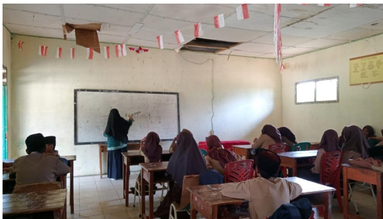
Gambar 1.8 Keadaan Ruang Kelas VII