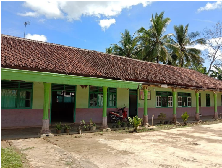
Gambar 1.2 Ruang Guru dan Tata Usaha