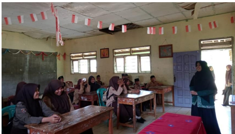
Gambar 1.5 Wawancara dengan peserta didik