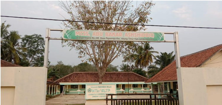
Gambar 1.1 Gerbang MTs Abu Bakar Ash-Shiddiq