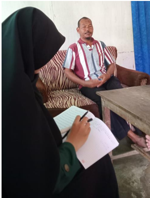
Gambar 1.4 Wawancara dengan Guru Bahasa Arab