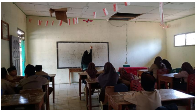
Gambar 1.6 Observasi di Kelas VII