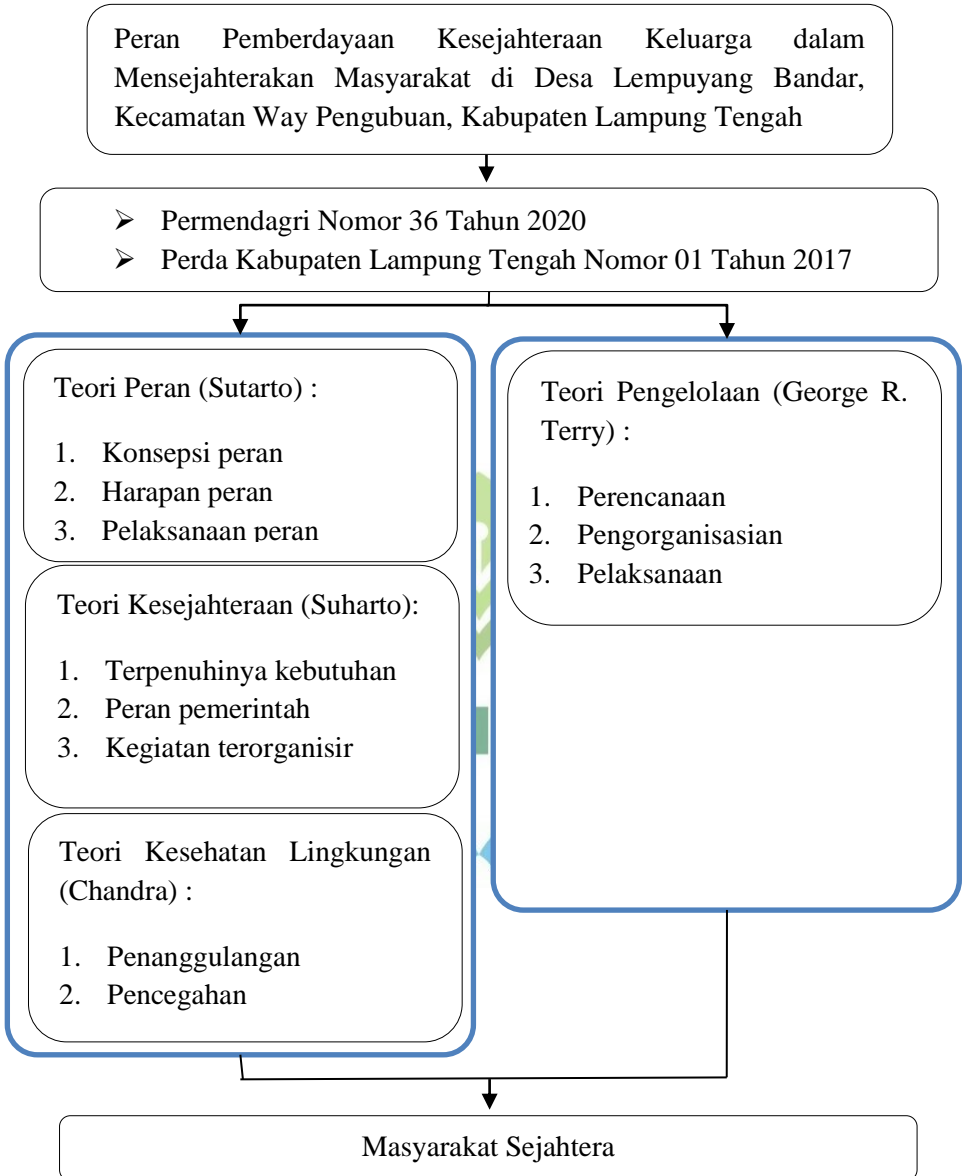
Gambar 1. 1 Kerangka Pikir