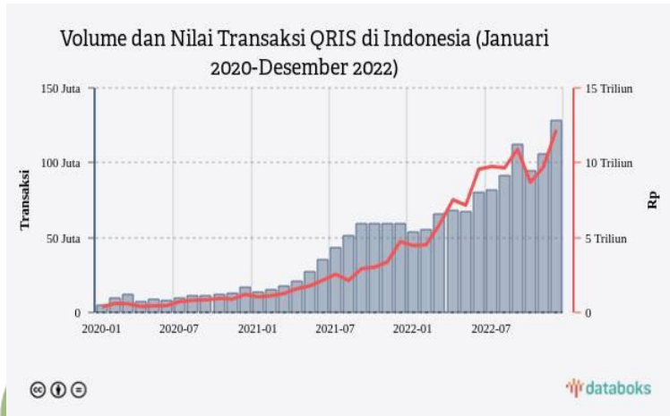
Gambar 1.1 Volume dan Nilai Transaksi QRIS di Indonesia (Januari 2020-Desember 2022)

uang saat kita bertransaksi serta membuat transaksi lebih cepat dilakukan dan mampu memberikan kepuasan kepada masyarakat.