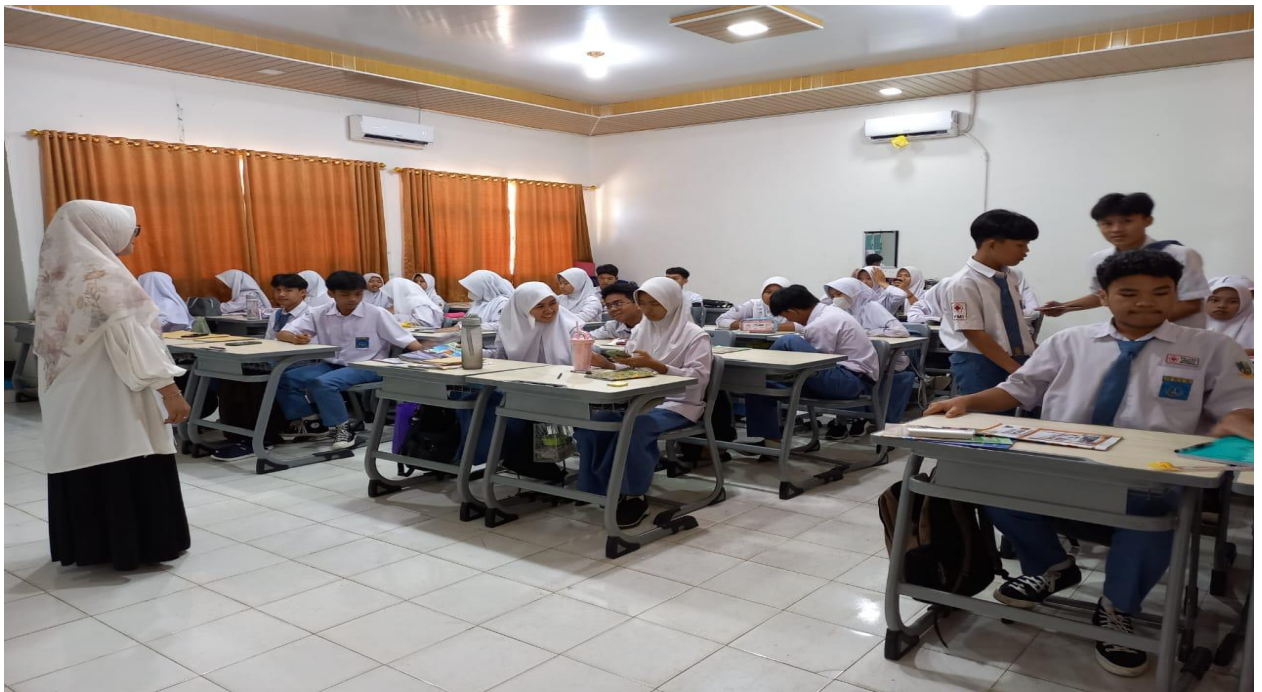
Kegiatan Belajar Mengajar MAN I Bandar Lampung