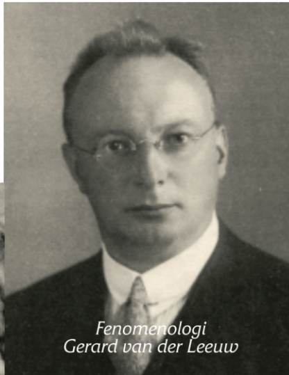
Fenomenologi Gerard van der Leeuw