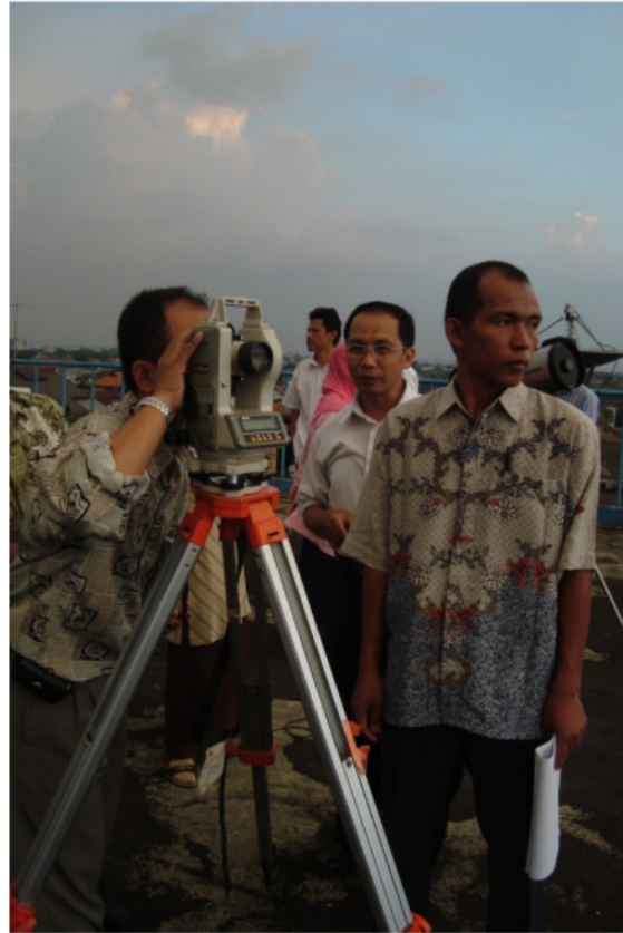
Gambar 2 Penggunaan Teodolit Untuk Rukyatul Hilal

Dan sumbu horizontal untuk melihat skala azimutnya, sehingga teropongnya yang digunakan untuk mengincar benda langit dapat bebas bergerak ke semua arah 207 .