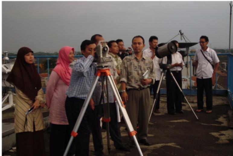
Gambar 1 Pelaksanaan Rukyatul Hilal

Ketika Matahari terbenam atau sesaat setelah itu, langit di sebelah Barat berwarna kuning kemerah-merahan, sehingga antara cahaya hilal yang putih kekuning-kuningan dengan warna langit yang melatarbelakanginya tidak begitu