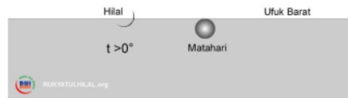
Gambar 8 Wujudul Hilal