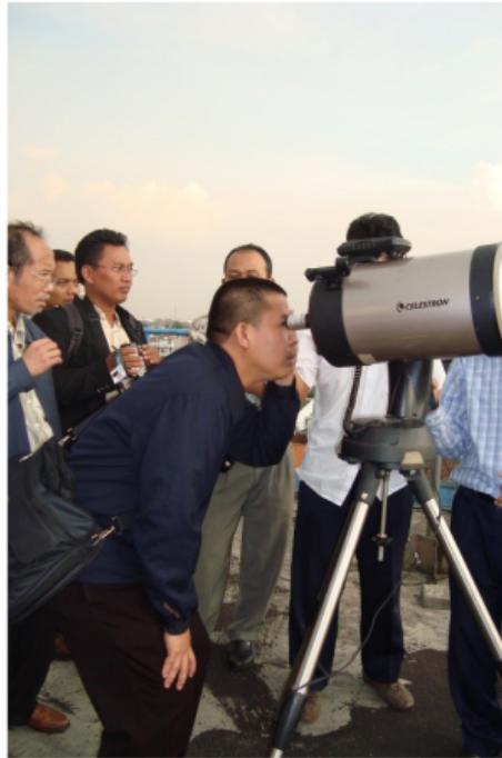
Gambar 5 Penggunaan Teleskop untuk Rukyatul Hilal