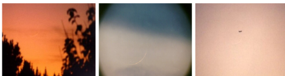
Gambar 7 Hilal