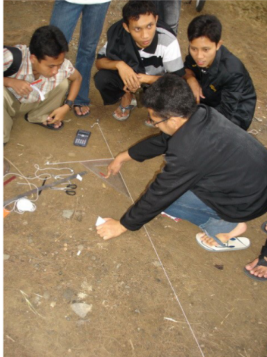
Gambar 4 Pembuatan Benang Azimut untuk Rukyatul Hilal