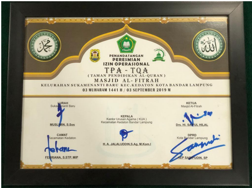
Dokumentasi pada Tanggal 17 Oktober 2022 Peresmian Izin Operasional (Kementerian Agama)