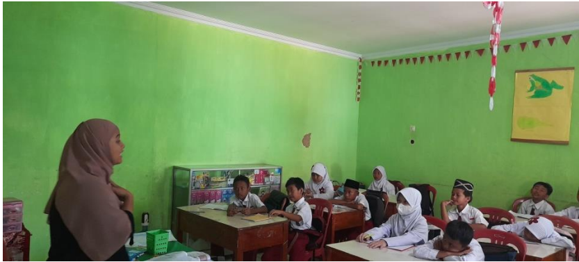
FOTO PENULIS MELAKSANAKAN TES PELAFALAN SECARA LISAN