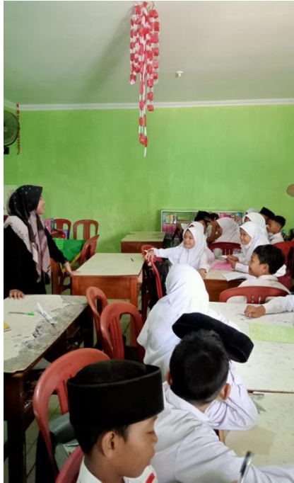
Peserta didik melaksanakan model scramble