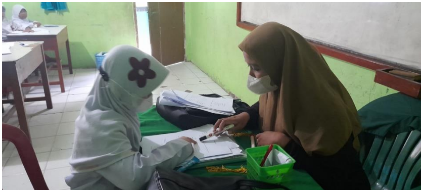
FOTO PESERTA DIDIK MELAKSANAKAN TES TERTULIS PENGUASAAN KOSA KATA