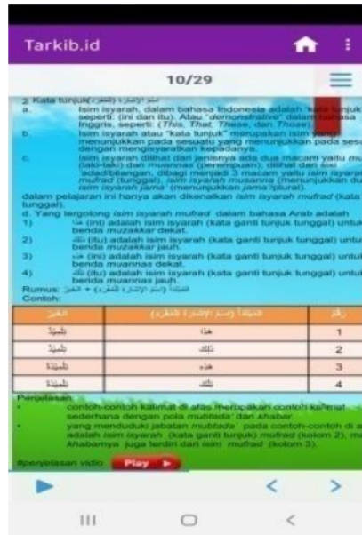
الصورة ٣ وصف المواد