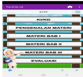
الصورة ٢ الكفاءات الأساسية أو الاختصاص الأساسي، مقدمة المواد، مادة الفصل ١، ٢، و٣، والتقييم