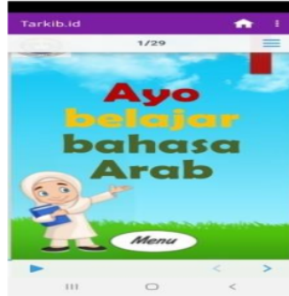
الصورة ١ غلاف التطبيق

يتكون كل نشاط تعليمي من مكونات أهداف التعلم، وأوصاف المواد، والملخصات، وأسئلة التدريب في شكل اختيار من متعدد. صفحة الغلاف الخاصة بمنتج التطبيق هي صفحة العنوان وهوية المستخدم. صفحة عنوان التطبيق "هيا بنا نتعلم اللغة العربية". لجذب انتباه الطلاب، تم تجهيز صفحة العنوان برسوم متحركة لرسم متحركة للأطفال. يمكن رؤية لقطة شاشة لصفحة العنوان في الصورة.