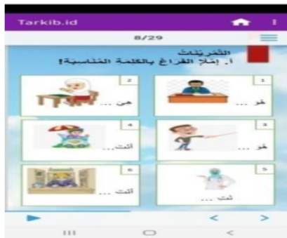
الصورة ٥ أسئلة التدريب