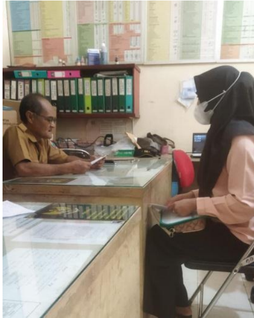
Wawancara dengan Kepala Desa Rangai Tri Tunggal