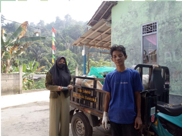
Wawancara dan Foto bersama dengan Selamat selaku Masyarakat Yang Mendapat Bantuan CSR Dan Teler Bank Sampah