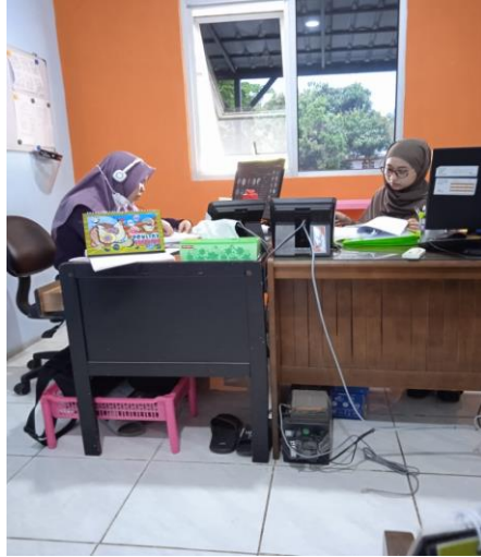
(Memahami Buku Penjualan Bibit Ayam di PT. Japfa Comfeed Indonesia Tbk Poultry Breeding Division, Campang Jaya Kecamatan Sukabumi Bandar Lampung)