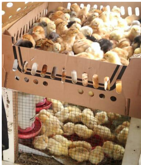
(Jenis Bibit Ayam Layer Petelur)