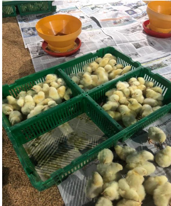
(Jenis Bibit Ayam Broiler)