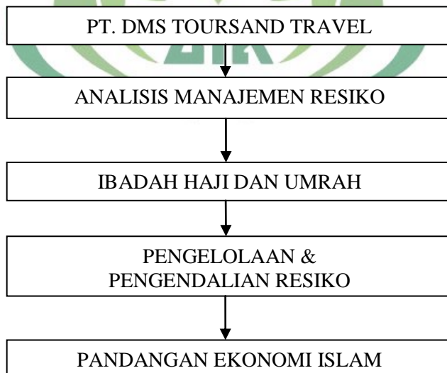
Gambar 1.1 Kerangka pemikiran

Pada gambar diatas menjelaskan bahwa PT DMS Toursand Travel merupakan salah satu biro jasa perjalanan haji dan umrah di kota Bandar Lampung yang hingga saat ini masih terus berkembang. Sejauh ini selama masa pandemi Covid19 PT DMS