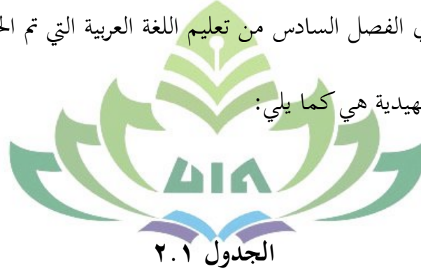
بيانات نتائج اختبار مهارة قراءة النص العربي للطلاب الفصل السادس تعليم اللغة العربية

علاوة على ذلك ، فإن البيانات المتعلقة بنتائج اختبار مهارة قراءة النص العربي للطلاب في الفصل السادس من تعليم اللغة العربية التي تم الحصول عليها من هذه الدراسة التمهيدية هي كما يلي: